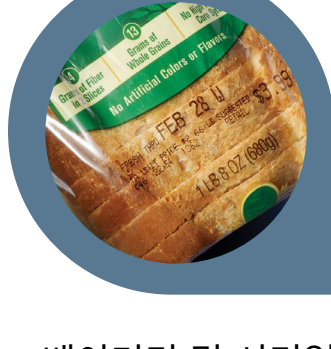
베이커리 및 시리얼